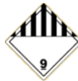
UN Class 9 algemeen gevaar label.